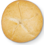
Falta de horneado