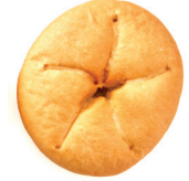
Exceso de levado