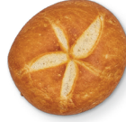
Exceso de horneado